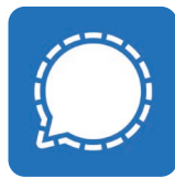
Signal (voir fiche 8.8)